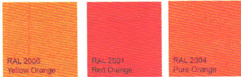
Figura 22 – imagem da série RAL 2000 - laranja