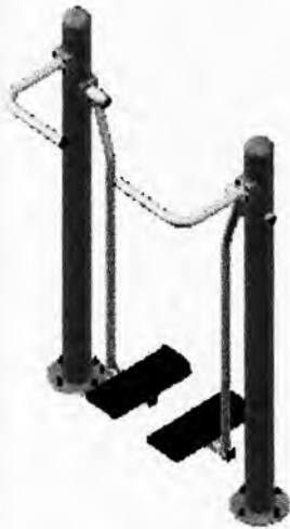
3 - PATINS