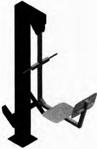
1 - BALANÇA