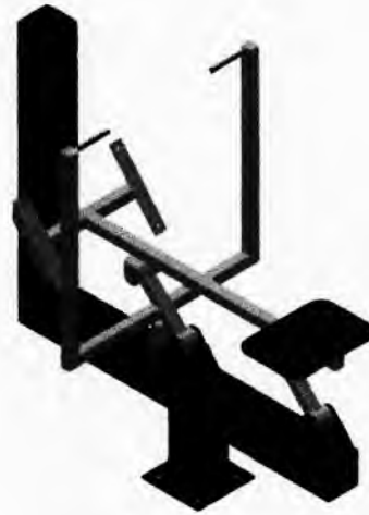
2 - REMO