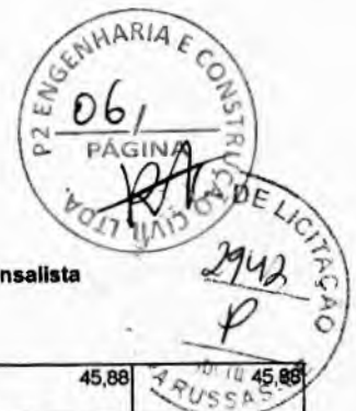
Tabela Ref.: SEINFRA 27.1 DESONERADA - SINAPI 01/2023 DESONERADA BDI: 26,00% - Encargos Sociais: SEINFRA: 83,85% - Horista e 47,76% - Mensalista / SINAPI: 84,44% - Horista e 47,48% - Mensalista

Tomada de Preços N°. SI-TP007/2023. Obra: Pavimentação na Zona Urbana. Local: Município de Nova Russas - CE