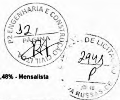
Tabela Ref.: SEINFRA 27.1 DESONERADA - SINAPI 01/2023 DESONERADA BDI: 28,00% - Encargos Sociais: SEINFRA: 83,85% - Horista e 47,76% - Mensalista / SINAPI: 84,44% - Horista e 47,48% - Mensalista

Tomada de Preços N°. SI-TP007/2023. Obra: Pavimentação na Zona Urbana. Local: Município de Nova Russas - CE