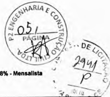
Tabela Ref.: SEINFRA 27.1 DESONERADA - SINAPI 01/2023 DESONERADA BDI: 28,00% - Encargos Sociais: SEINFRA: 83,85% - Horista e 47,76% - Mensalista / SINAPI: 84,44% - Horista e 47,48% - Mensalista

Tomada de Preços N°. SI-TP007/2023. Obra: Pavimentação na Zona Urbana. Local: Município de Nova Russas - CE