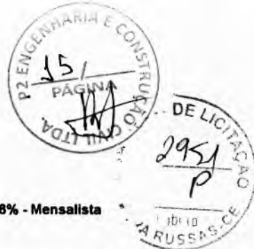
Tabela Ref.: SEINFRA 27.1 DESONERADA - SINAPI 01/2023 DESONERADA BDI: 26,00% - Encargos Sociais: SEINFRA: 83,85% - Horista e 47,76% - Mensalista / SINAPI: 84,44% - Horista e 47,48% - Mensalista

Tomada de Preços N°. SI-TP007/2023. Obra: Pavimentação na Zona Urbana. Local: Município de Nova Russas - CE