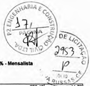
Tabela Ref.: SEINFRA 27.1 DESONERADA - SINAPI 01/2023 DESONERADA BDI: 26,00% - Encargos Sociais: SEINFRA: 83,85% - Horista e 47,76% - Mensalista / SINAPI: 84,44% - Horista e 47,48% - Mensalista

Tomada de Preços N°. SI-TP007/2023. Obra: Pavimentação na Zona Urbana. Local: Município de Nova Russas - CE