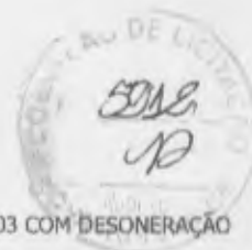
TABELA: SEINFRA 027.1 E SINAPI 2023/03 COM DESONERAÇÃO BDI: 24,52%

OBRA: CONSTRUÇÃO DE UMA UNIDADE BÁSICA DE SAÚDE PORTE I LOCAL: VIA LOCAL 02, LOTEAMENTO NOVA RUSSAS, PANTANAL - NOVA RUSSAS/CE REF.: TOMADA DE PREÇOS Nº SS-TP002/2023 RAZÃO SOCIAL: CLEZINALDO CONSTRUÇÕES LTDA - EPP CNPJ: 22.575.652/0001-97