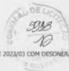
TABELA: SEINFRA 027.1 E SINAPI 2023/03 COM DESONERAÇÃO BDI: 24,52%

OBRA: CONSTRUÇÃO DE UMA UNIDADE BÁSICA DE SAÚDE PORTE I LOCAL: VIA LOCAL 02, LOTEAMENTO NOVA RUSSAS, PANTANAL - NOVA RUSSAS/CE REF.: TOMADA DE PREÇOS Nº SS-TP002/2023 RAZÃO SOCIAL: CLEZINALDO CONSTRUÇÕES LTDA - EPP CNPJ: 22.575.652/0001-97