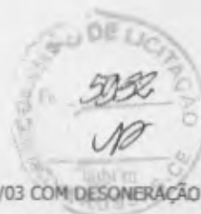
TABELA: SEINFRA 027.1 E SINAPI 2023/03 COM DESONERAÇÃO BDI: 24,52%

OBRA: CONSTRUÇÃO DE UMA UNIDADE BÁSICA DE SAÚDE PORTE I LOCAL: VIA LOCAL 02, LOTEAMENTO NOVA RUSSAS, PANTANAL - NOVA RUSSAS/CE REF.: TOMADA DE PREÇOS Nº SS-TP002/2023 RAZÃO SOCIAL: CLEZINALDO CONSTRUÇÕES LTDA - EPP CNPJ: 22.575.652/0001-97