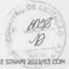
TABELA: SEINFRA 027.1 E SINAPI 2023/03 COM DESONERAÇÃO BDI: 24,52%

OBRA: CONSTRUÇÃO DE UMA UNIDADE BÁSICA DE SAÚDE PORTE I LOCAL: VIA LOCAL 02, LOTEAMENTO NOVA RUSSAS, PANTANAL - NOVA RUSSAS/CE REF.: TOMADA DE PREÇOS Nº SS-TP002/2023 RAZÃO SOCIAL: CLEZINALDO CONSTRUÇÕES LTDA - EPP CNPJ: 22.575.652/0001-97