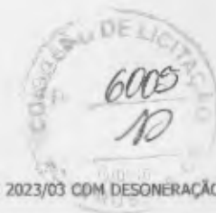
TABELA: SEINFRA 027.1 E SINAPI 2023/03 COM DESONERAÇÃO BDI: 24,52%

OBRA: CONSTRUÇÃO DE UMA UNIDADE BÁSICA DE SAÚDE PORTE I LOCAL: VIA LOCAL 02, LOTEAMENTO NOVA RUSSAS, PANTANAL - NOVA RUSSAS/CE REF.: TOMADA DE PREÇOS Nº 55-TP002/2023 RAZÃO SOCIAL: CLEZINALDO CONSTRUÇÕES LTDA - EPP CNPJ: 22.575.652/0001-97